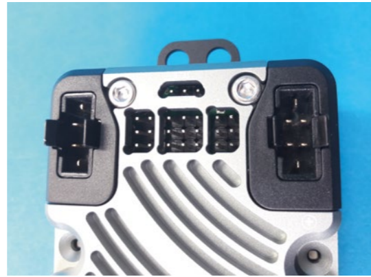
Die IN-Ports für die Verbindung zum Empfänger befinden sich auch auf der Oberseite der EVO. Hier werden mittels der beiliegenden Patchkabel die sieben einzelnen Kanäle vom Empfänger mit der EVO verbunden. Zudem ist hier der Port für den Telemetrieanschluss zum Empfänger und die beiden MPX-Ports für die Akkus zur Spannungsversorgung.