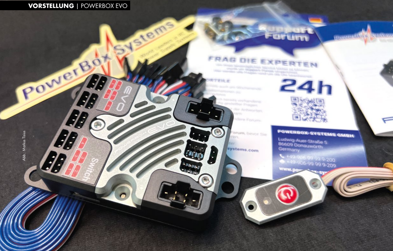
Abb.: Markus Teilus