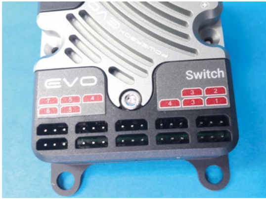
Auf dem Gehäuse findet man eine eindeutige Beschriftung der OUT-Steckplätze für die Servoanschlüsse. Es werden insgesamt sieben Kanäle angeboten, die Kanäle 3, 4 und 5 sind doppelt belegt; hier können bei Bedarf zwei Servos angesteckt werden.