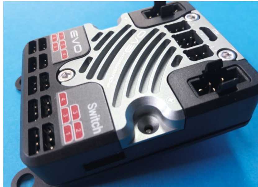
Der gefräste Aluminiumkühlkörper ist im Gehäuse integriert und ähnelt denen der größeren Systeme. Er ist ein integraler Bestandteil des Kühlkonzepts und sorgt für eine hohe Dauerbelastbarkeit.

Telemetriesystem wird automatisch erkannt, es müssen hier keine weiteren Einstellungen vorgenommen werden. Beide Akkuspannungen können so vom Sender aus überwacht werden. Man kann aber auch jederzeit den Ladezustand der angeschlossenen Akkus an den beiden dreifarbigem LEDs des MicroSwitch ablesen. Der gefräste Aluminium-Kühlkörper ist im Gehäuse integriert und ähnelt denen der größeren Systeme. Er ist ein integraler Bestandteil des Kühlkonzeptes und sorgt für eine hohe Dauerbelastbarkeit. Die EVO kann an jedem beliebigen Ort und in jeder beliebigen Ausrichtung im Modell eingebaut werden, da keinerlei Kreisel-sensorik integriert ist.